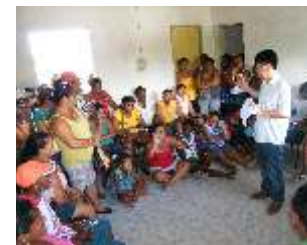
Reuniões dos projetos de compensação

De acordo com as orientações e diretrizes do IBAMA, a compensação deve fortalecer os grupos sociais afetados pelos empreendimentos e que têm menos condições para intervir nos processos decisórios que afetam seu modo de vida.