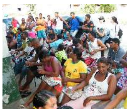
Facilitadores da UFS e comunidades durante devolutivas