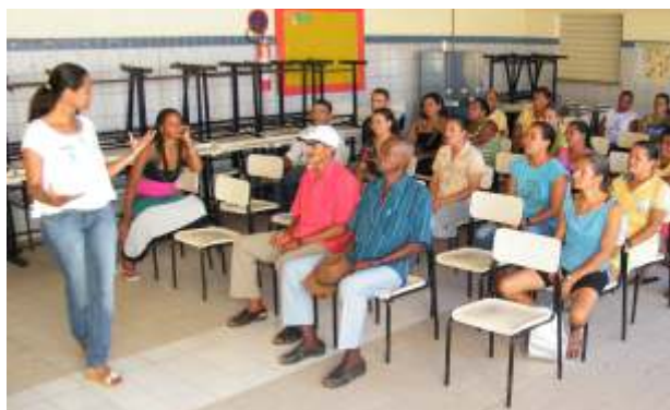
Diversas oficinas realizadas para elaboração do diagnóstico

Foi finalizado em abril de 2011 o diagnóstico socioambiental dos municípios de Coruripe, Feliz Deserto e Piaçabuçu, localizados na costa sul de Alagoas. Elaborado como exigência do IBAMA, o estudo tem a finalidade de complementar dados de Estudo de Impacto Ambiental elaborado para a região com o objetivo de mensurar os impactos socioeconômicos da atividade de exploração de petróleo e gás natural da Petrobras sobre as atividades pesqueiras na região.