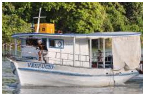
Embarcação para campanha na foz de rios

Coordenado pelo Centro de Pesquisas da Petrobras – CENPES, o projeto conta com a participação de uma equipe multidisciplinar de professores e pesquisadores da Universidade Federal de Sergipe - geólogos, geoquímicos, biólogos e oceanógrafos.