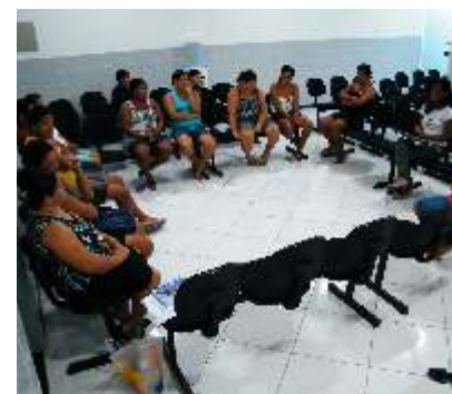
Marisqueiras durante reuniões para trabalho de fortalecimento da sua atividade