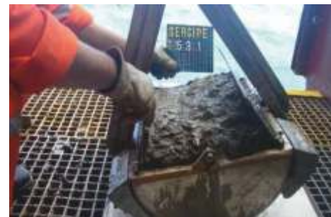
Coleta de sedimento