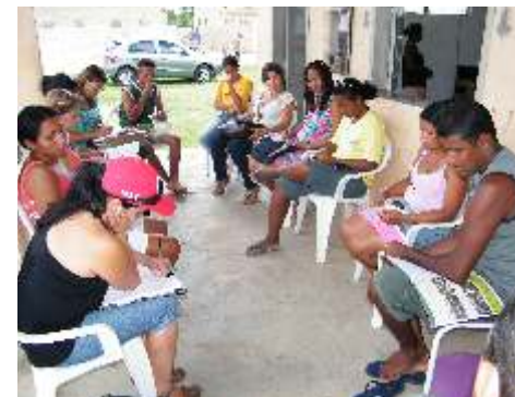
Reuniões dos projetos de compensação

■ Projeto de Caracterização Regional Pág. 5