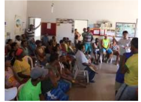
Reuniões dos projetos de compensação