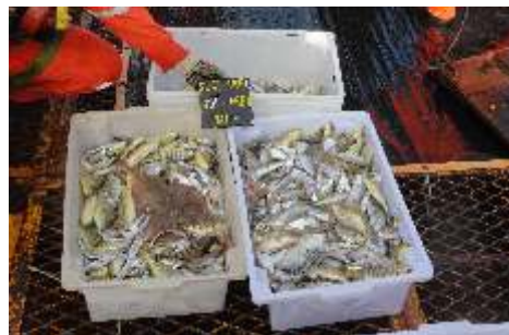
Separação dos peixes capturados