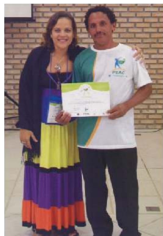
Conselheiros ao serem diplomados por representantes da UFS e da Petrobras

Atualmente, o PEAC é executado pela Petrobras juntamente com a Universidade Federal de Sergipe (UFS), entidade conveniada para atuar nos dois principais projetos do Programa: Desenvolvimento Social e Monitoramento Participativo de Desembarque Pesqueiro.