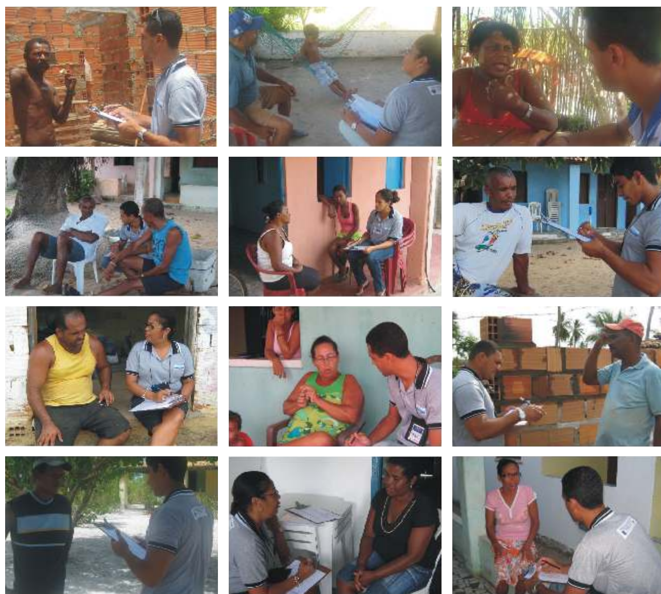
Comunidades sendo entrevistadas para avaliação do Programa de Comunicação

Caso queira opinar sobre as reuniões e os outros meios usados pela Petrobras, entre em contato pelo email launseal@petrobras.com.br ou pelos demais contatos divulgados no encarte do Informativo. Esta participação é fundamental para que as informações cheguem da melhor forma possível.