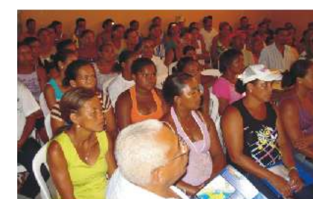
Boca da Barra (Pacatuba)