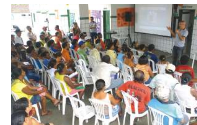
Crasto (Sta. Luzia do Itanhi)