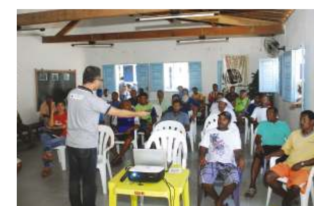
Pontal do Coruripe