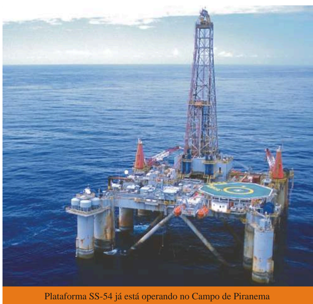
Plataforma SS-54 já está operando no Campo de Piranema

O IBAMA emitiu em janeiro Licença de Operação para perfuração de 19 novos poços nos blocos BM-SEAL-4, 10 e 11, conhecido como Polígono de Águas Profundas. Válida até janeiro de 2016, a Licença permite à Petrobras ampliar as fronteiras exploratórias de águas profundas, já que os novos poços localizam-se além do Campo de Piranema (maiores informações na próxima edição).