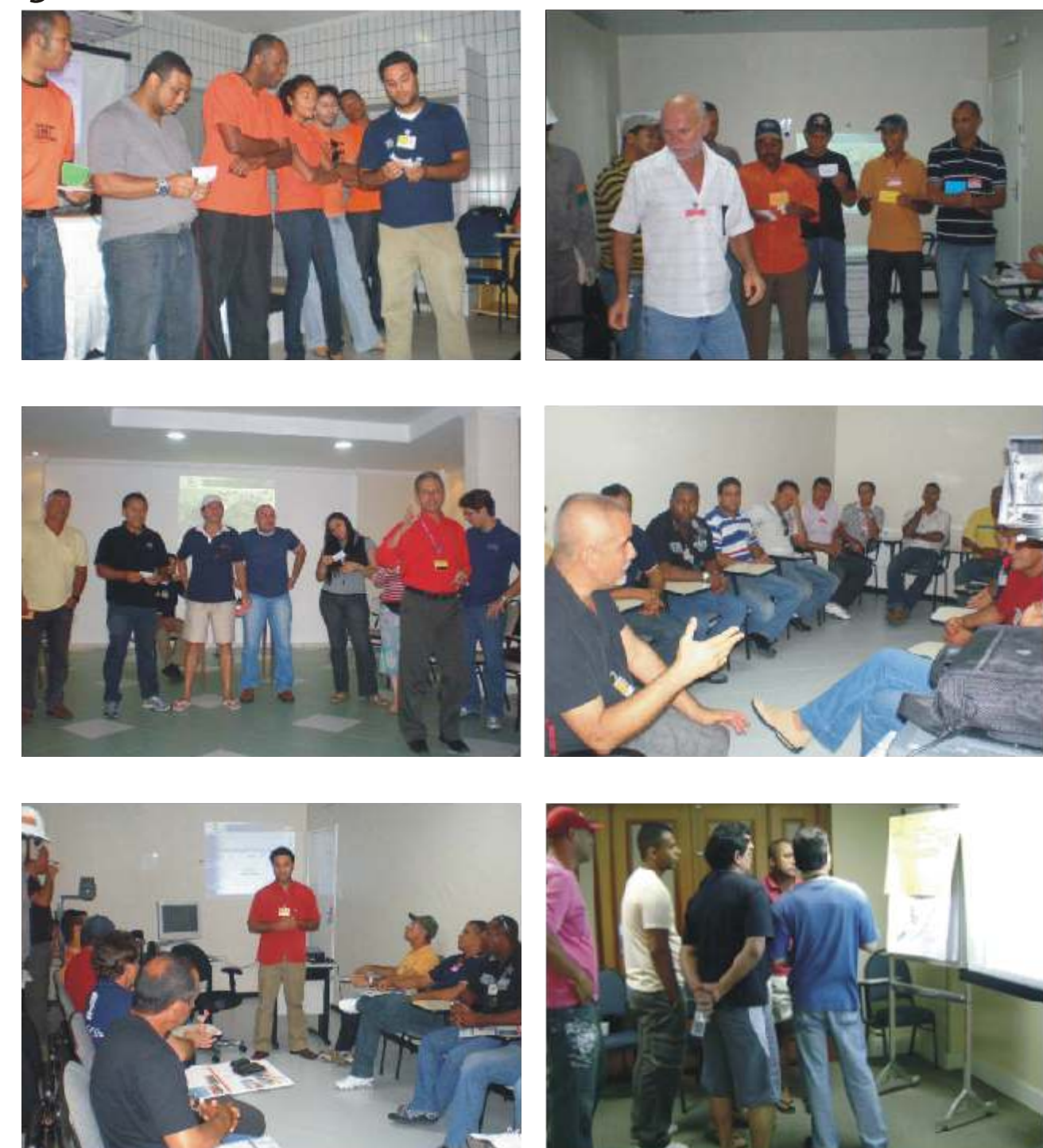
Nas imagens, palestras, cursos e treinamentos realizados longo do ano de 2009

Essa porcentagem se explica pelo regime de trabalho das embarcações, ficando os funcionários pendentes para a turma seguinte, quando deverão ser atingidos os 100% de contemplados.