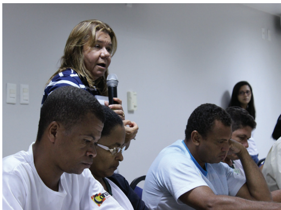
Representante da Adema, órgão ambiental do Estado de Sergipe, esclarece dúvidas dos conselheiros

Atendendo a uma demanda levantada por delegados e conselheiros durante o último Encontro do PEAC, representantes da Superintendência Federal de Pesca e Aquicultura em Sergipe e da Adema – Administração Estadual do Meio Ambiente de Sergipe compareceram à reunião ordinária do Conselho ocorrida no mês de março. As conversas estiveram voltadas para a relação entre esses dois órgãos e a atividade pesqueira, o esclarecimento de dúvidas e a comunicação de denúncias ambientais que impactam os pescadores e marisqueiras.