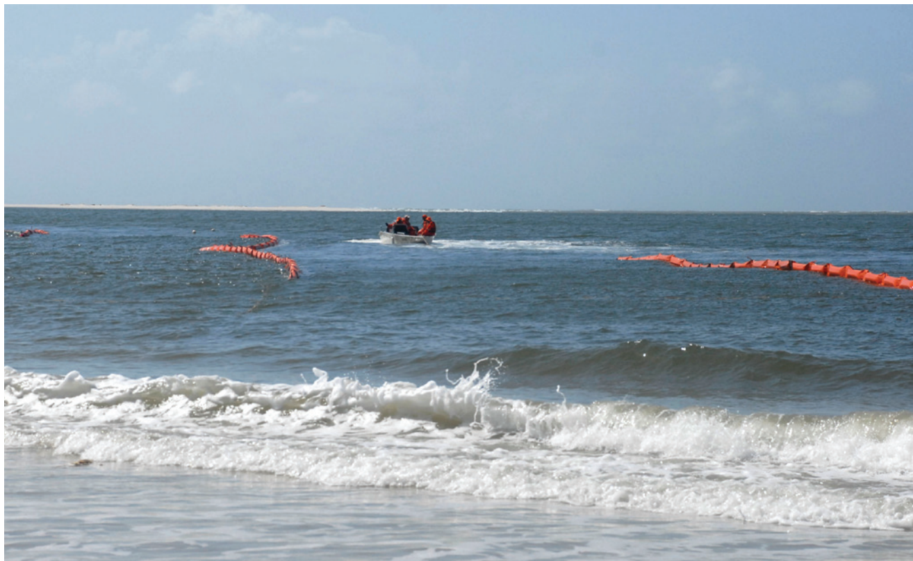
Formação de barreira próximo à foz do rio Real teve caráter preventivo para impedir passagem de óleo para o estuário