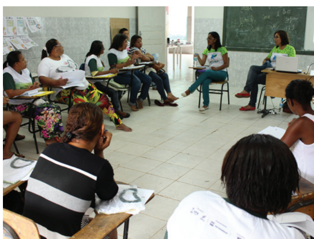
Reunião formativa das marisqueiras

O evento será realizado em outubro como atividade do projeto Fortalecimento da Organização de Base das Marisqueiras, executado dentro do PEAC