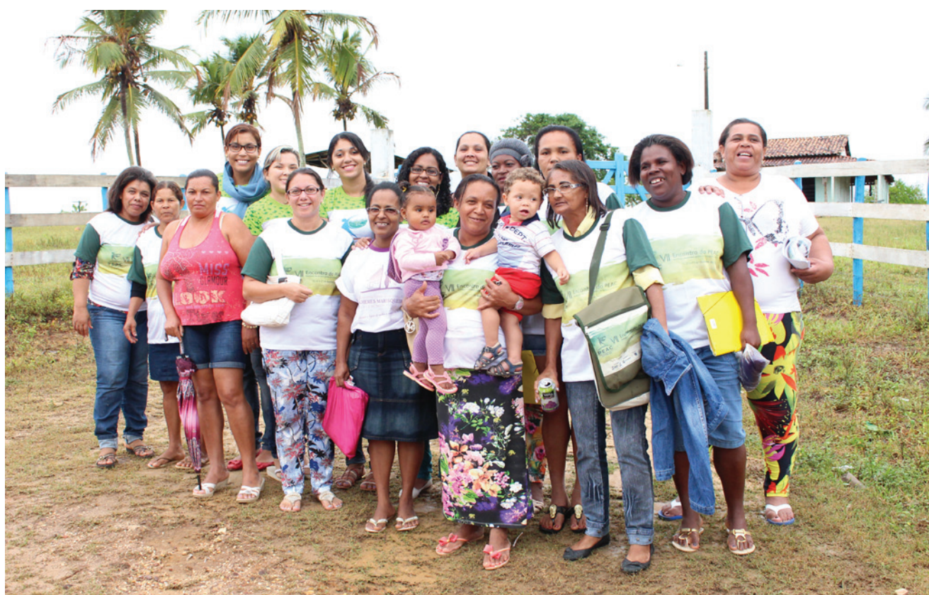
Comissão do encontro com equipe técnica do projeto de Fortalecimento da Organização de Base das Marisqueiras

O II Encontro Inter-Regional das Marisqueiras será realizado em outubro, em local a ser confirmado, e deverá reunir cerca de 100 mulheres. O evento é parte de uma estratégia de