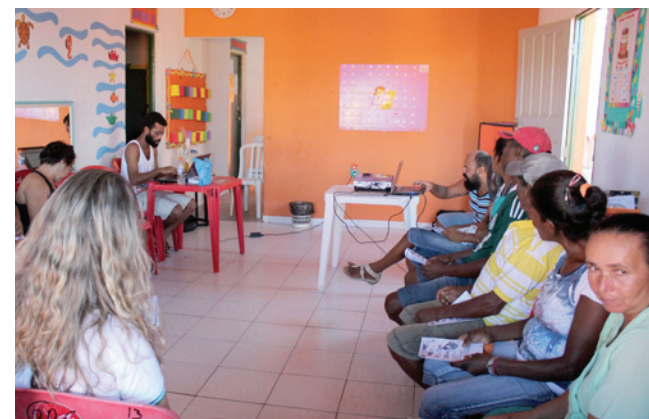
Reunião com grupo de trabalho do Observatório

Executado como projeto do PEAC, o Observatório Social dos Royalties tem, desde o final de janeiro, um grupo de trabalho constituído por representantes das 10 comunidades participantes do projeto, desenvolvido como piloto no município de Pirambu. O grupo tem a finalidade de promover a discussão sobre a distribuição e aplicação dos recursos dos royalties provenientes da produção de petróleo e gás.