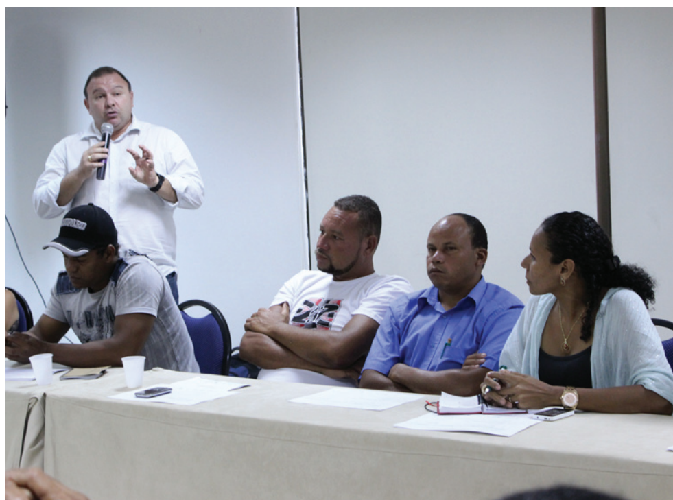
Conversa com representante do Ministério da Pesca e Aquicultura

Algumas comunidades também passaram a contar com assessoria técnica solicitada pelos conselheiros