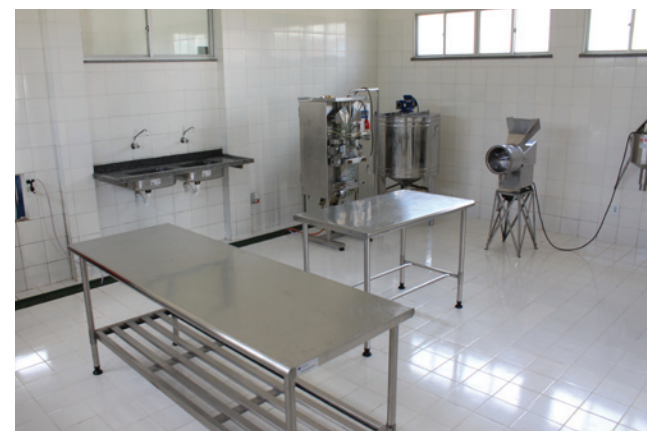
Equipamentos da fábrica de polpa podem processar até 1500 kg de fruta por dia

Com capacidade para processar até 1500kg de fruta por dia, a obra vai beneficiar as 90 famílias que vivem no assentamento. Segundo o