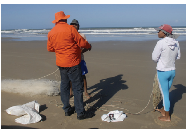
Abordagem a pescadores na praia das Dunas, no município de Estância

mando do incidente, onde pôde acompanhar, juntamente com lideranças da Petrobras, o andamento das respostas e determinar ações específicas, a exemplo do monitoramento da