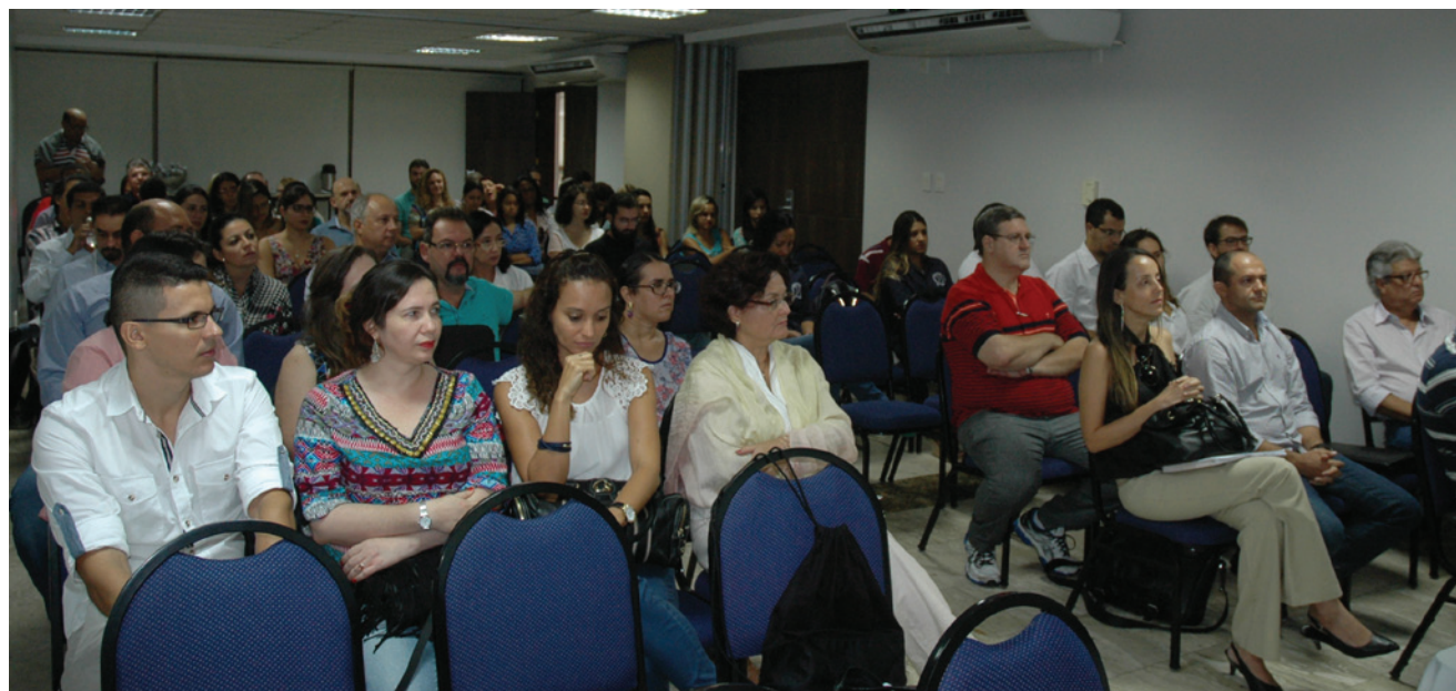
Equipe de pesquisadores e técnicos durante oficina em Aracaju

A área de estudo do projeto está localizada na costa leste brasileira, tendo como limites o litoral sul de Alagoas e o rio Piauí-Real, entre Sergipe e Bahia