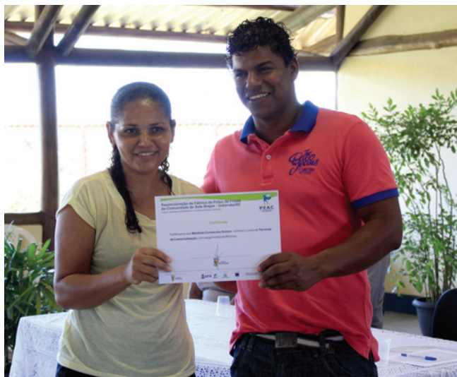
Conselheiro do PEAC por Indiaroba entrega certificado em Sete Brejos