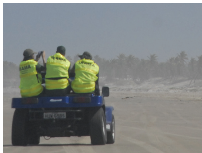
Equipes do IBAMA monitoraram o trabalho de limpeza de praias até que todos os resíduos fossem recolhidos