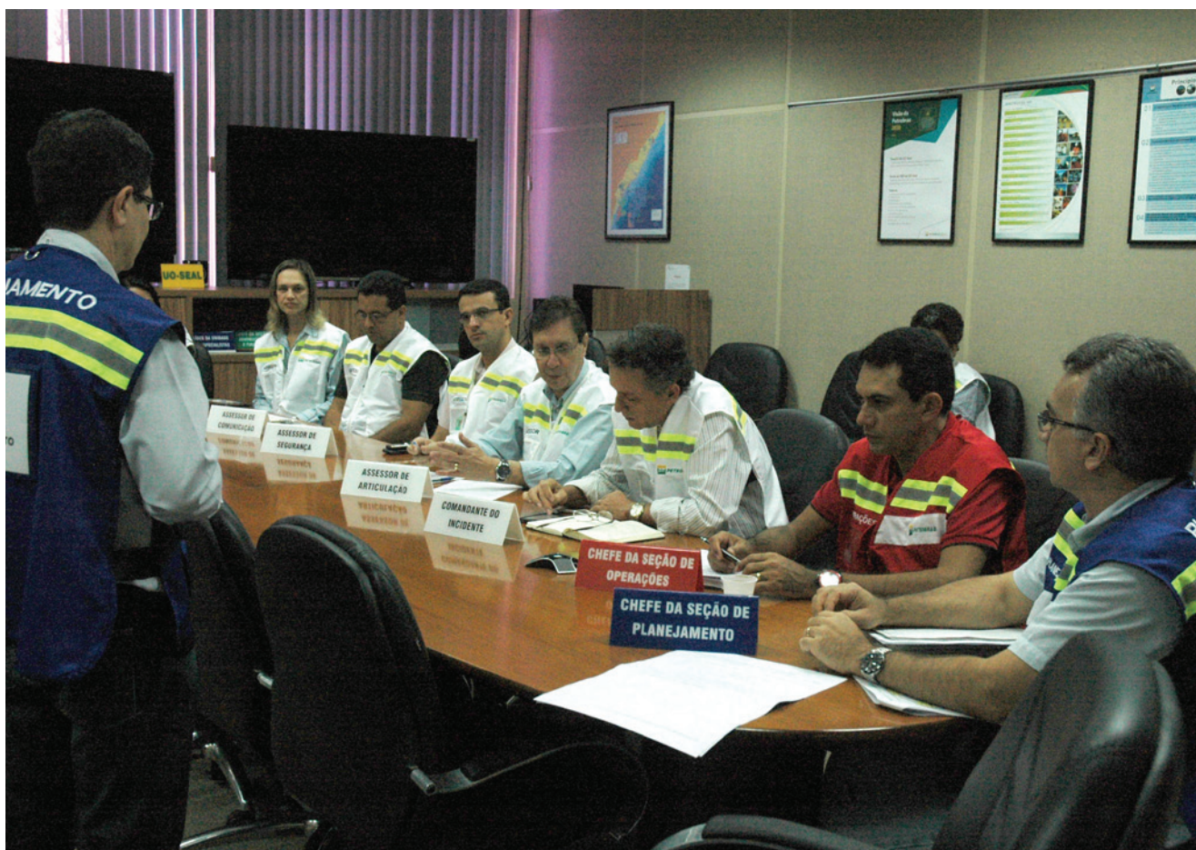
A sala de emergência onde ocorreu o comando das ações de combate à poluição foi montada na sede da Petrobras em Aracaju