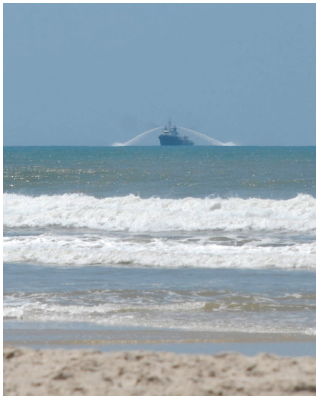
Embarcação realiza dispersão mecânica de óleo no mar

O trabalho foi resultante de um vazamento de óleo em duto que interliga duas plataformas da Petrobras