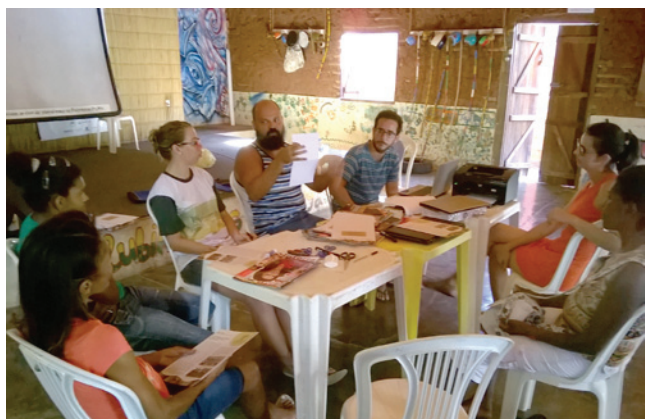
Elaboração do Jornal-Zine e distribuição durante feira no município de Pirambu

A proposta do Observatório é fomentar a discussão qualificada sobre royalties da produção de petróleo