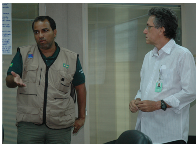
Representantes do IBAMA também acompanharam a emergência na sala de comando do incidente

de Alagoas e o litoral norte da Bahia até o município de Camaçari. São eles: rios Coruripe, São Francisco, Sergipe, Vaza-Barris, Real, Itapicuru, Sauípe e Pojuca.