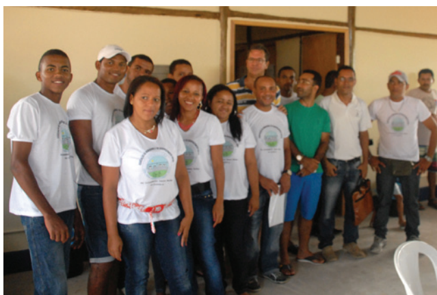
Jovens que se capacitaram em Lauro Rocha