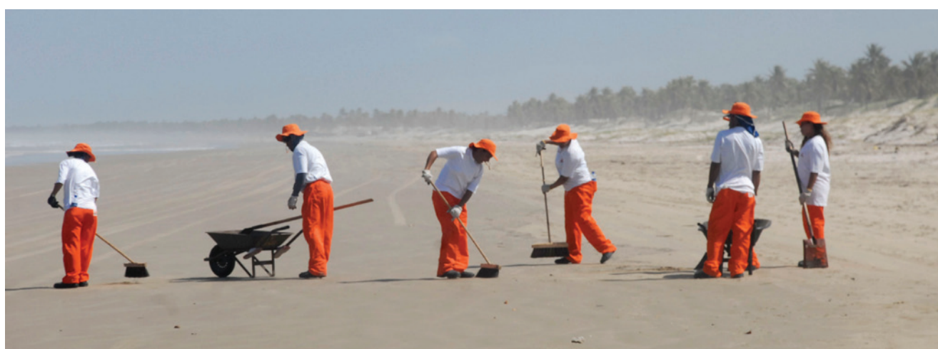
A limpeza de praia foi intensa durante a emergência e chegou a envolver 170 agentes ambientais atuando ao mesmo tempo

No dia 23 de abril foi identificado um vazamento num duto que interliga as plataformas PCM-5 e PCM-6, no campo de Camorim, localizado no litoral de Aracaju, a aproximadamente 10 km da costa. O volume vazado atingiu 7 metros cúbicos de óleo. O vazamento foi interrompido no mesmo dia e a estrutura organizacional de resposta a emergências foi acionada para as ações de combate à poluição.