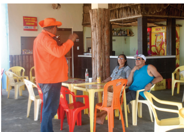
Uma equipe de relacionamento com as comunidades percorreu toda a extensão de praias atingidas para informar sobre a ocorrência de óleo no local

O IBAMA monitorou, durante todo o período de operações, as ações adotadas, tanto em campo (com realização de sobrevoos para verificação da existência de óleo e atividade de limpeza de praias) quanto na sala de co-