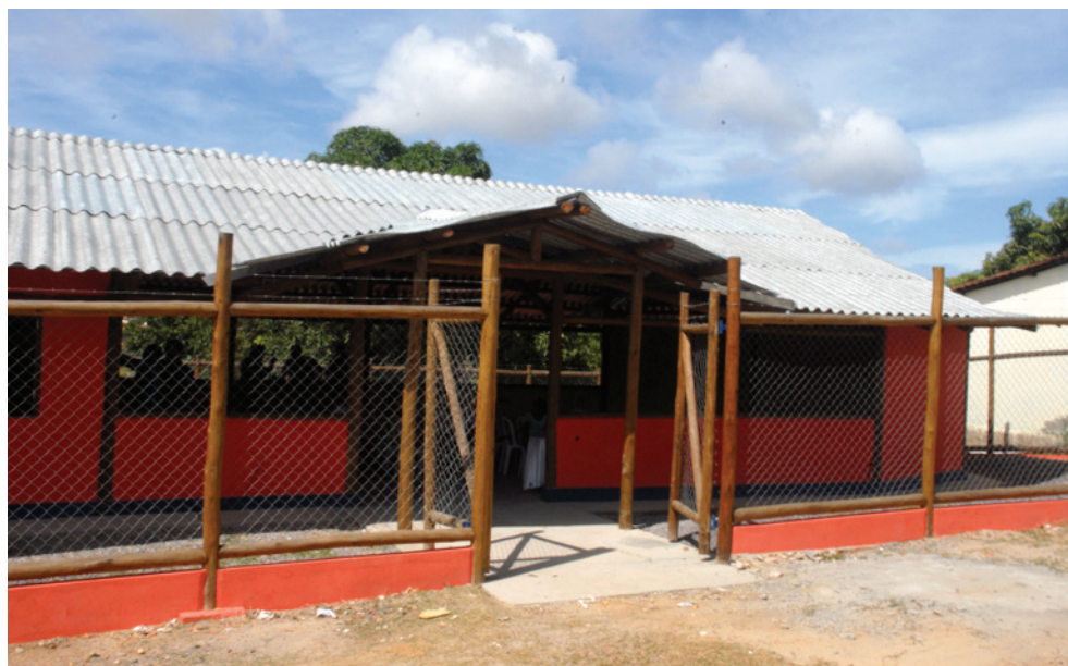
Visão frontal do Centro Comunitário de Lauro Rocha, em São Cristóvão