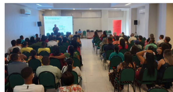
Reunião do PCSR em Aracaju (SE)

sendo os itens da pauta uma demanda do órgão ambiental. O evento conta ainda com uma sessão de perguntas.