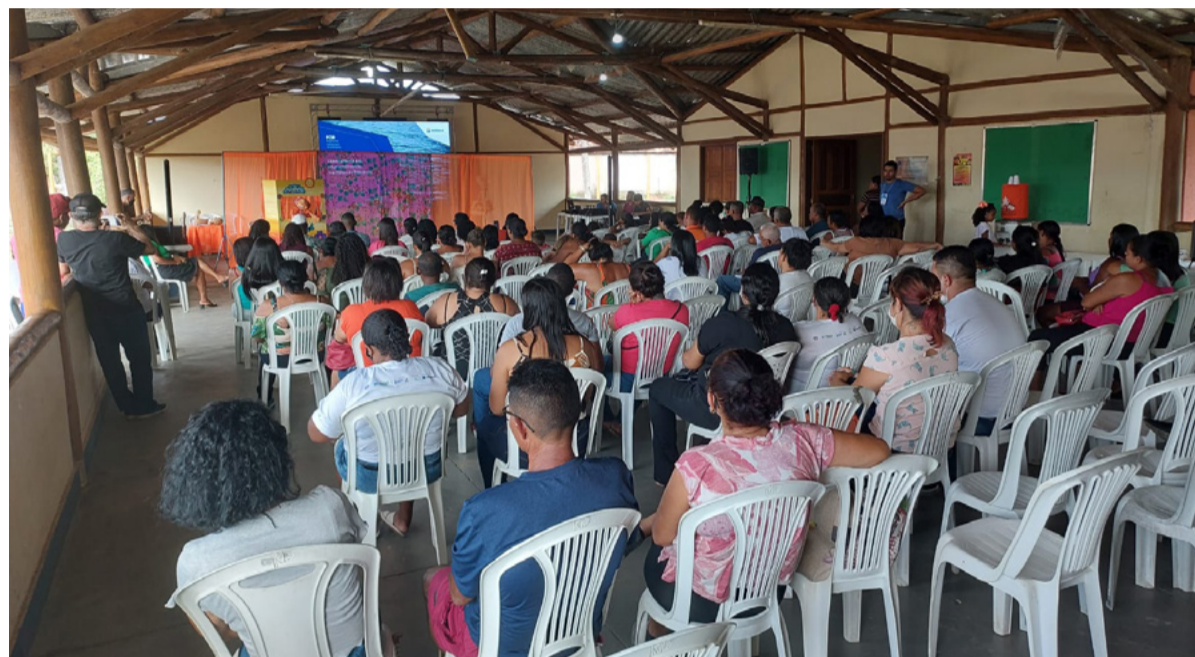
Reunião do PCSR em Pacatuba (SE)