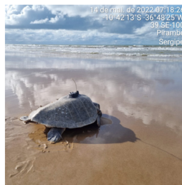
Um dos 10 indivíduos de tartaruga-oliva monitorados, com o transmissor de dados acoplado ao casco

Ainda que de forma preliminar, é possível indicar que as tartarugas acompanhadas tendem a permanecer poucos dias na região antes de migrarem para outras áreas, apresentando três tendências de destinação: direção sul, em que o animal permanece próximo à costa, culminando na região Sudeste do Brasil; direção Norte, em que o animal permanece próximo à costa, saindo do Brasil, subindo em direção às Guianas; direção Nordeste, em que o animal permanece próximo à costa por certo tempo, depois se