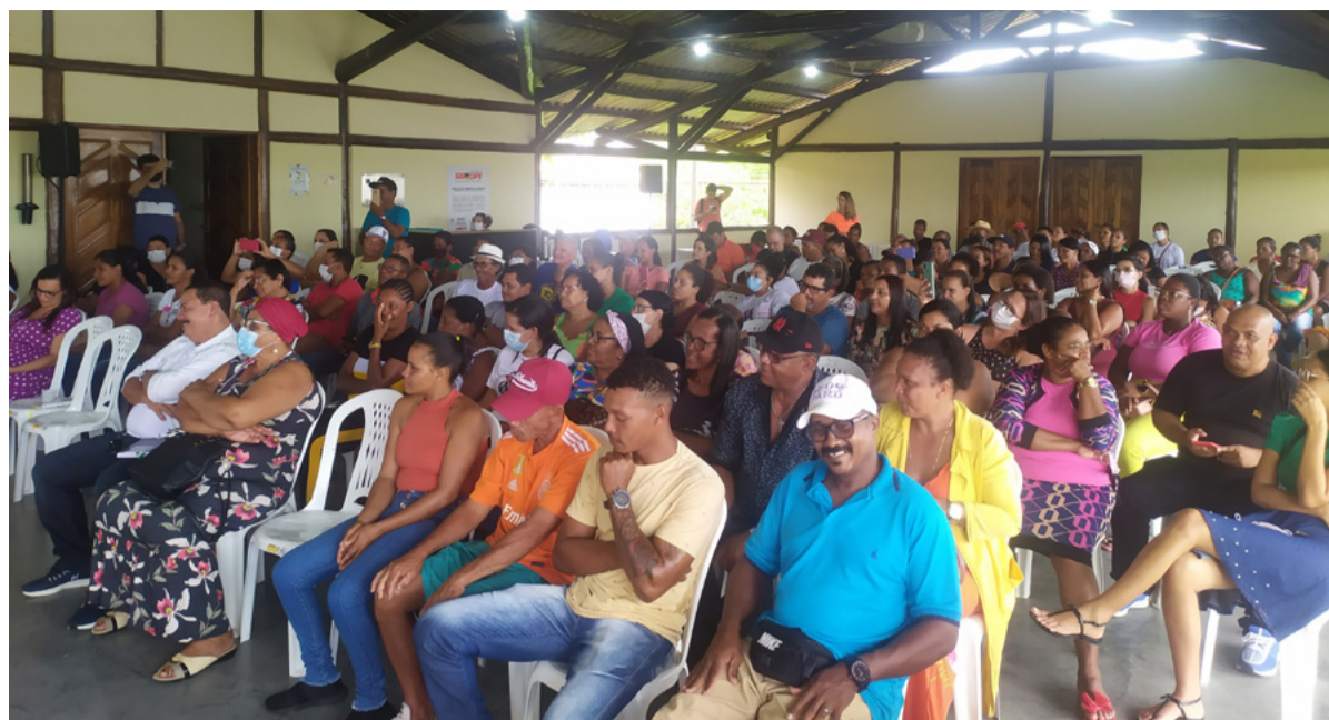
Reunião do PCSR em Indiaroba (SE)

As reuniões do PCSR são realizadas anualmente de forma regionalizada, num total aproximado de 100 comunidades atendidas. Como ocorria nos anos anteriores, a programação do evento contou com uma apresentação teatral para disseminar conteúdos sobre os mais de 10 projetos ou programas de mitigação ambiental executados como condicionantes do licenciamento ambiental conduzido pelo IBAMA, além de uma apresentação que atualiza a situação dos empreendimentos marítimos e aborda o tema dos royalties de petróleo e gás,