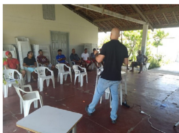
Oficinas devolutivas do PMPDP realizadas, respectivamente, nos povoados Saramém (Brejo Grande-SE) e Mosqueiro, em Aracaju-SE

Após a realização dos cálculos e análises estatísticas, os dados foram apresentados