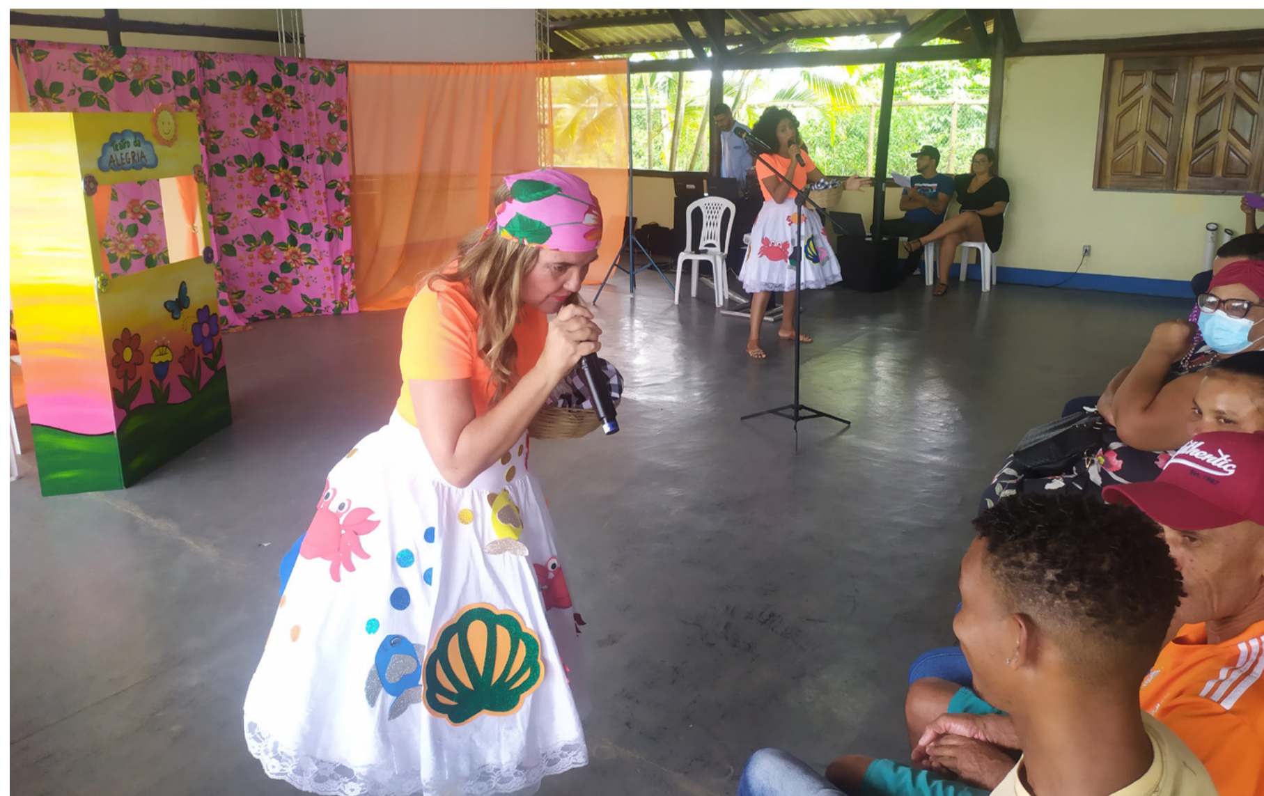
Peça do grupo teatral destacou projetos e programas do licenciamento

As reuniões do PCSR são voltadas para as comunidades, representantes do poder público (executivo e legislativo) e de organizações da sociedade civil organizada.