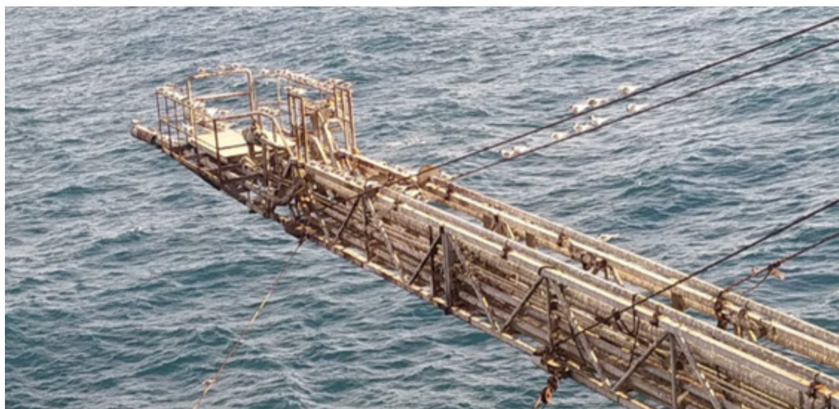
Aves da espécie Sterna sp. (Trinta-réis) pousados em lança queimador do navio-sonda SS-73

O PMAVE-SEAL vem sendo executado desde setembro de 2018. Até maio de 2022, registrou, por ocasião/oportunidade, 721 ocorrências de aves marinhas vivas/mortas nas instalações localizadas na bacia. Em quatro anos, o projeto registrou oito espécies: Sterna hirundo (Trinta-réis-boreal), Sterna sp. (Trinta-réis), Puffinus griseus (Pardela-escura), Columba livia