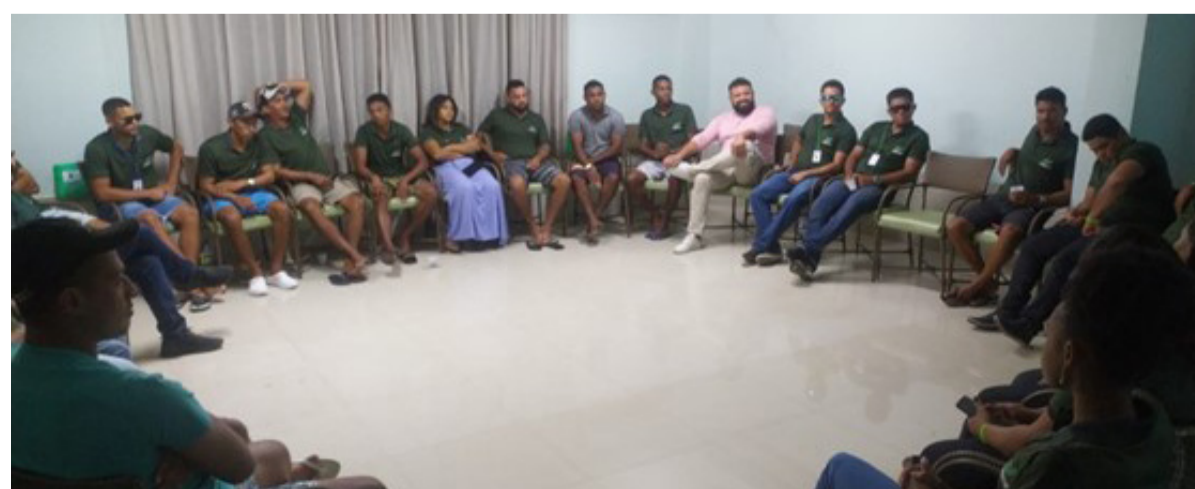
Encontro da equipe do PMPDP ocorrido em outubro de 2022

importante instrumento de avaliação dos dados pesqueiros tendo em vista que os pescadores e pescadoras são os maiores conhecedores da realidade local. Além das devolutivas, o PMPDP promoveu, em outubro de 2022, em Aracaju, o encontro da equipe do projeto com o objetivo de fazer o alinhamento e padronização do trabalho de coleta de dados. O evento contou com 32 participantes, entre coletores de dados, supervisores, coordenadores e um representante da Petrobras.