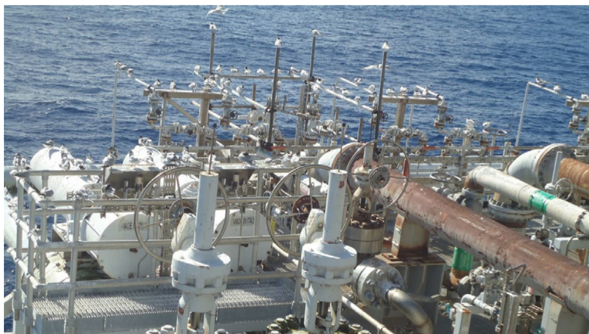
Aglomeração da espécie Trinta-réis nas estruturas da plataforma Piranema Spirit

Após o desembarque das eventuais aves resgatadas, o PMAVE-SEAL conta com a consultoria ambiental de uma equipe especializada, que fará os procedimentos de estabilização, reabilitação ou necropsia, e soltura na natureza, quando possível. Na impossibilidade de soltura, os animais são encaminhados para instituições especializadas ou eutanasiados.